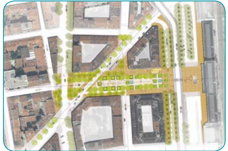
Le square s'étendra de la place Jules Ferry au boulevard des Brotteaux