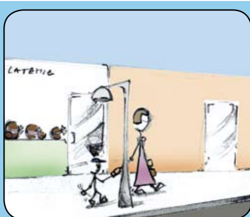
- Y'en a pas ! On rentre.