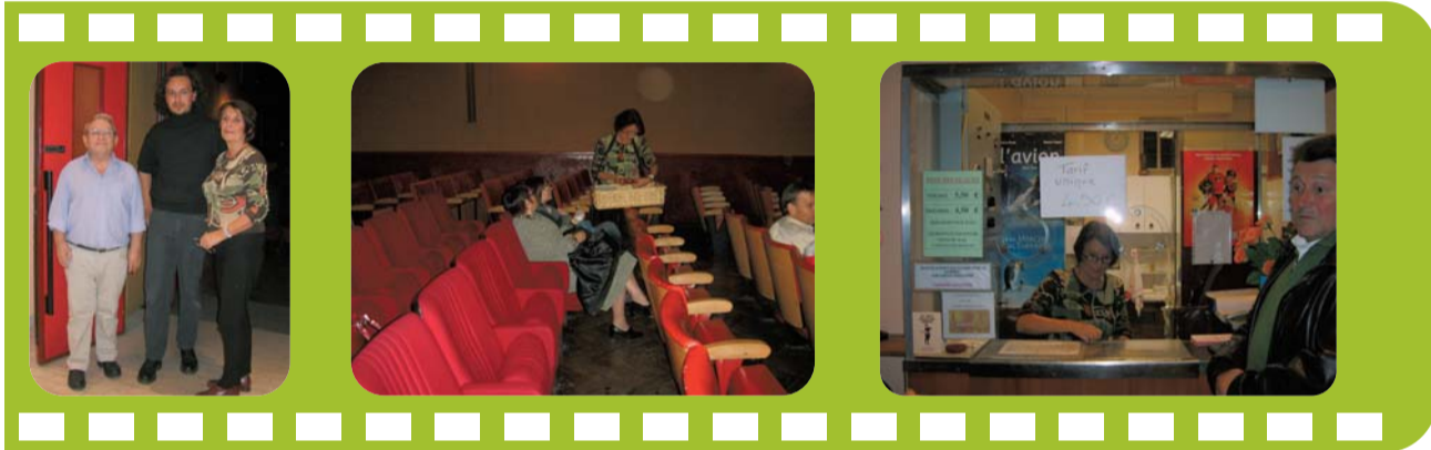
Une équipe de bénévoles qui fait vivre le 7ème Art dans le 6ème arrondissement