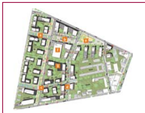
La ZAC du Bon Lait

Concept créé par l'abbé Lemir au 19 e siècle, ces bouts de terre donnés aux ouvriers pour compenser celle perdue en venant travailler en ville sont encore particulièrement visibles à Gerland. Ces jardins devaient empêcher les ouvriers d'aller au bistrot et les inciter à rester en famille, œuvrant ainsi pour une cohésion familiale et sociale, grâce à la convivialité et la solidarité qu'ils créaient entre les jardiniers. Pour en posséder un, il fallait habiter Lyon depuis plus de 3 ans, être retraité ou en voie de l'être, ou être en activité avec une famille à charge. En 1945, il y avait 3500 jardins, aujourd'hui il en reste 350 dans toute la ville. Ces jardins sont, jusqu'à présent, non constructibles à Gerland, autre caractéristique de ce quartier.