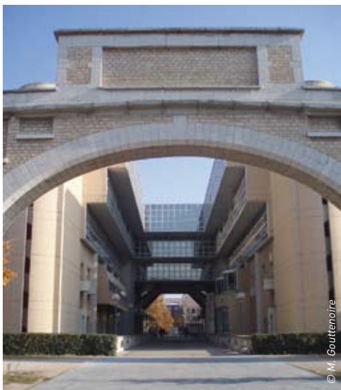
L'arche imaginée par Tony Garnier pour les abattoirs

Le début du XXI e siècle voit l'arrivée de l'École normale supérieure lettres et sciences humaines (Déménagement de l'ENS Fontenay en 2000), ainsi que de nombreux logements et commerces et un grand parc urbain dans le sud de Lyon. Sur 20 hectares, le parc de Gerland s'étend sur d'anciennes friches industrielles. Le quartier est relié à La Part Dieu par la ligne B du métro depuis 2000. En 2001, une annexe de l'université Lyon 1 s'installe le long de l'avenue Tony Garnier, avenue sur laquelle poussent, depuis une dizaine d'années, bureaux et laboratoires dans le cadre de la création en 1998 d'un Technopôle centré autour d'activités de haute technologie, renommé ensuite « Lyon Métropole Innovante ».