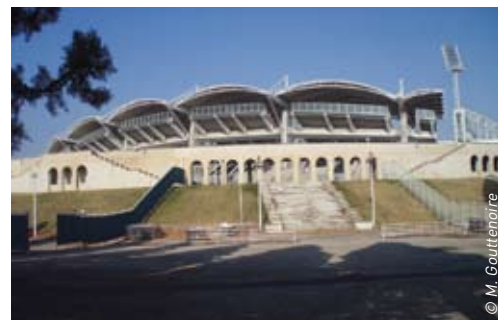
Le stade de Gerland

Créée en 1998 par la Communauté Urbaine, le plan d'action Technopôle avait pour objectif de favoriser le développement économique de l'agglomération par le soutien à la recherche et à l'innovation. La communauté urbaine a souhaité poursuivre cette politique sur la base d'un concept renommé « Lyon Métropole Innovante ». Il s'agit, tout en s'appuyant sur les réalisations du Plan Technopôle et en les confortant, d'améliorer les démarches et de décloisonner les communautés industrielles, scientifiques et institutionnelles.