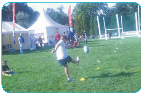
Les enfants ont pu se tester pendant deux semaines à un concours de pénalités au Parc de la Tête d'Or...

Ce n'est pas tous les jours que des centaines d'Australiens, Néo-Zélandais, Argentins ou Japonais, se baladent dans les rues de Lyon dans une ambiance si festive. Si les trois rencontres de la Coupe du monde de rugby, que les Lyonnais ont pu voir à Gerland, n'ont duré qu'une semaine, la Ville compte sur le 20 octobre et la finale sur écran géant à Bellecour pour conclure en beauté cet événement planétaire.