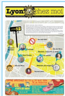
N°1 Fêtes des mères, Tri sélectif, Montchat...