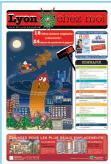
N°5 Noël, Fête des lumières, Brotteaux...