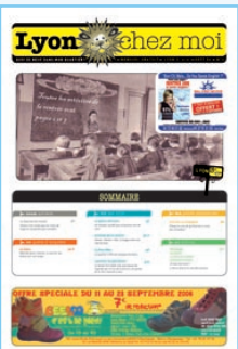
N°3 Rentrée 2006, Plaine Africaine, Bourse du travail...