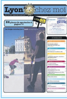
N°8 Berges du Rhône, Fête des Mères, S. Bernstein...