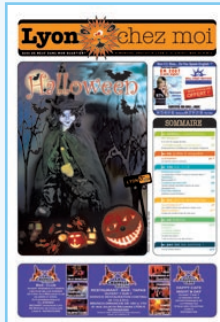
N°4 Halloween, La Guillotière, SOS Voyageurs...