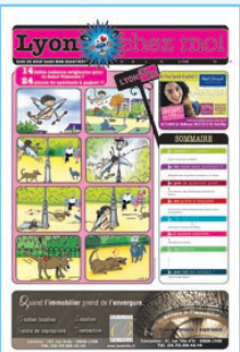
N°6 Restos du Cœur, pl Bahadourian, St Valentin...