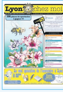
N°7 Pâques, Confluence, FéXSpray...