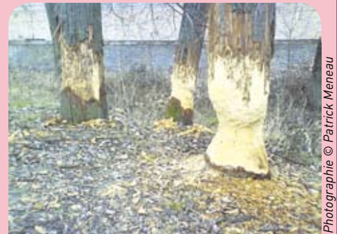
Là où les castors passent, les arbres trépassent...

Attendre encore, pour connaître le sort qui sera réservé à la piscine du Rhône, toujours pas décidé et savoir si l'aménagement des îles du Bretillod (« petit brotteaux », mot lyonnais qui désigne les endroits humides que les animaux broutaient) se fera comme prévu. En effet ce dernier est différé, notamment pour des raisons écologiques : comment préserver la faune et la flore. Principaux protagonistes au centre de ce débat : les castors !