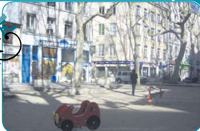
La place Voltaire comme vous ne la verrez plus