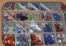
Bijoux : perles, nacrés, accessoires et cordons

Loisirs créatifs : Decopatch, peintures textile, objets décoratifs Tricot : Katia, Plassard, Fonty, Coton DMC, Feutrine, laine à feutrer et matériel Mercerie traditionnelle Broderie : Point compté, Hardanger et Broderie traditionnelle. Supports à broder : linge de maison, accessoires bébé, Canevas enfants, Fils à broder DMC, toiles et bandes à broder Customisation : rubans, boutons décoratifs, strass, paillettes ... Livres et revues de loisirs créatifs Service Encadrement