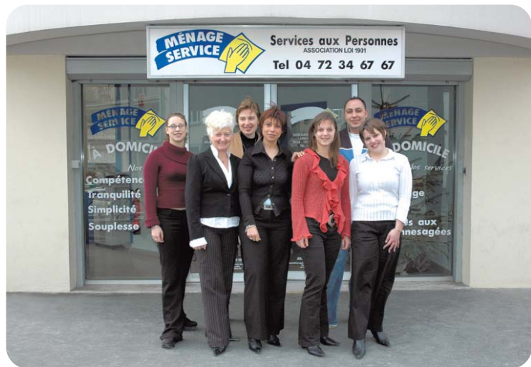
Une équipe parée à balayer vos soucis domestiques

500 000 : c'est le nombre d'emplois que le gouvernement souhaite créer dans le secteur des services à domicile. Pour savoir comment cela se passe sur le terrain, Lyon chez moi a suivi deux structures qui ont un point commun : une approche originale du mot « service ».