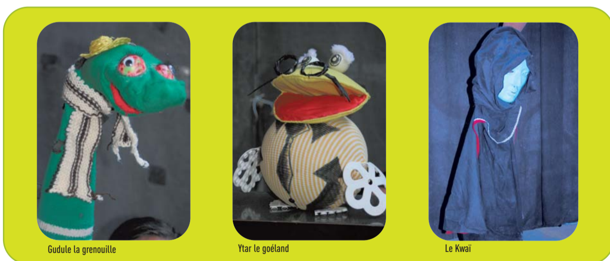
Gudule la grenouille