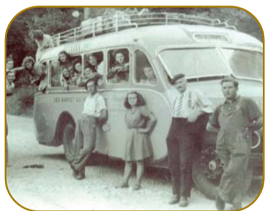
Les autocars, c'est une affaire de famille