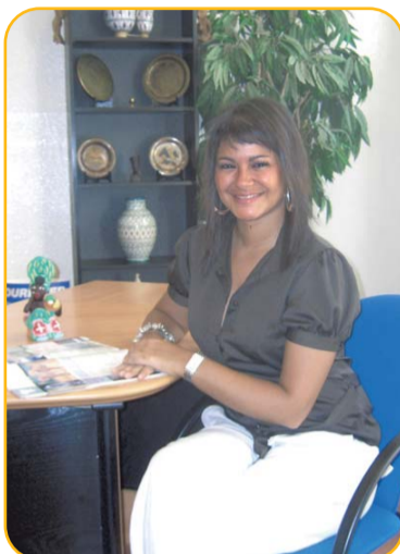
L'agence Ailleurs vous accueille avec le sourire dans le 3 ème ...

52 points de ramassage, de Roanne à Chambéry et de Dijon à Montélimar permettent aux clients des 26 agences de l'enseigne " Ailleurs " de débiter leur voyage tout près de chez eux.