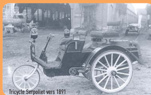
Tricycle Serpollet vers 1891