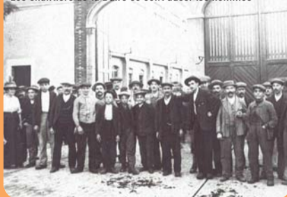
Les chantiers de la Buire ce sont aussi les hommes

Pour renverser la vapeur (car c'est bien de vapeur qu'il s'agissait), la société allait à nouveau faire preuve d'audace.