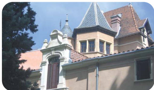
Le Château de la Buire vieux de 500 ans

Les premières traces du domaine de la Buire dans l'histoire locale remontent à 1560 et à Noble Benoît de Monconys, Seigneur de la Buire. Bordé du domaine de la Part-Dieu au nord et de celui de la Mothe au sud, cette seigneurie subsistait, comme ses voisins, les sauts d'humeur du Rhône et se trouvait fréquemment inondé. Elle se composait alors de terres agricoles, dominées par une maison forte : le château de la Buire. Ce château, une œuvre du XVI e siècle, comprenant une tourelle à six pans, a survécu jusqu'à nos jours (voir photo). Il se trouve à l'angle des rues Rachais et Garibaldi.